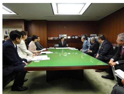
石井国土交通大臣に 要望内容を説明