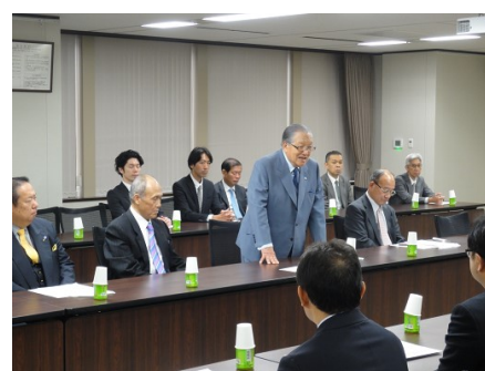
首都高速道路(株) (手前)に要望する、 幹線協メンバー (奥)