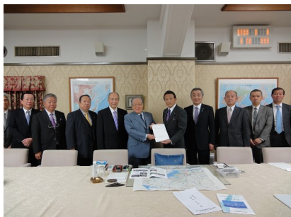
麻生財務大臣に要望書を提出