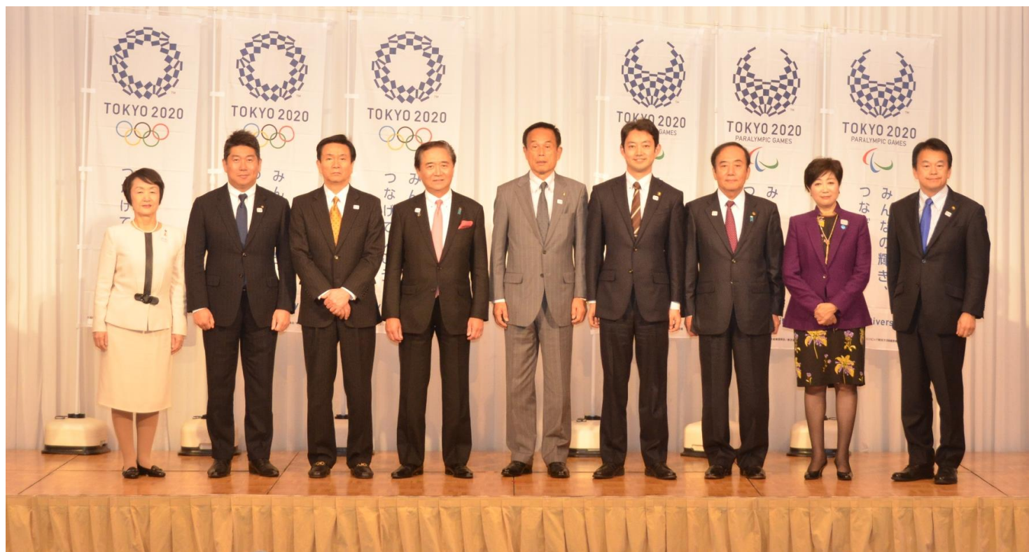
第72回九都県市首脳会議の出席者