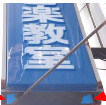
腐食して穴が開いています☹️

日ごろのチェックも必要ですが、 目安として設置後 10 年以上経過した看板は 、専門家の点検を受けるようにしましょう。 ※年数を問わず専門家の点検を義務付けている自治体もあります。