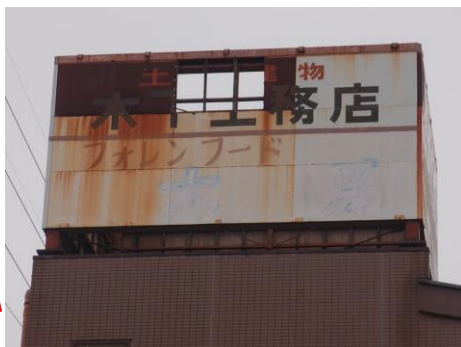
広告板が剥がれています☹️